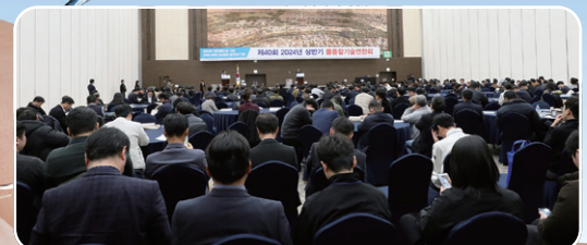
2024년 2월 9일 경주 HICO에서 개최된 「제40회 2024년 상반기 물종합기술연찬회」 모습.