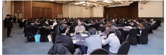
'제42회 2025년 상반기 물종합기술연찬회' 모습 (경주 라한호텔 컨벤션홀)