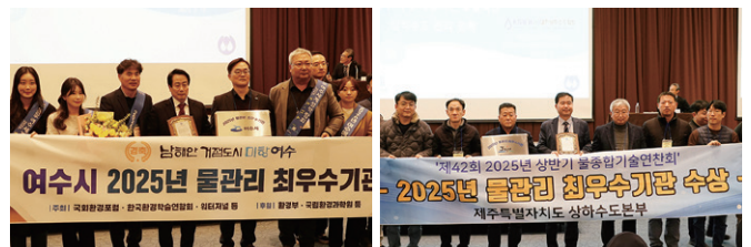
2025년 상반기 물관리 최우수기관 표창 (여주시·제주특별자치도 상하수도본부)