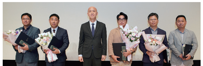
2025년 하반기 물관리 우수사례 및 우수기술 실용화 발표대회 최우수상(환경부장관상) 시상식 모습