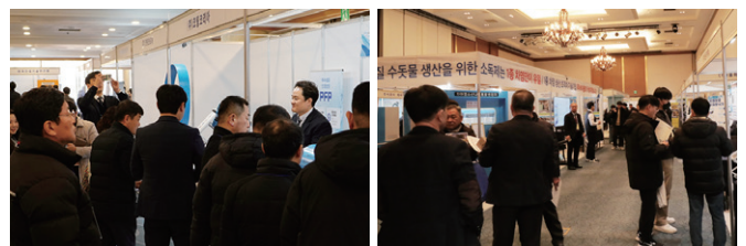
'제42회 2025년 상반기 물종합기술연찬회' 전시회 모습 (경주 라한호텔 컨벤션홀 로비 및 전시홀)