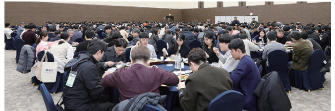
'제40회 2024년 상반기 물종합기술연찬회' 모습 (경주 HICO 컨벤션홀)